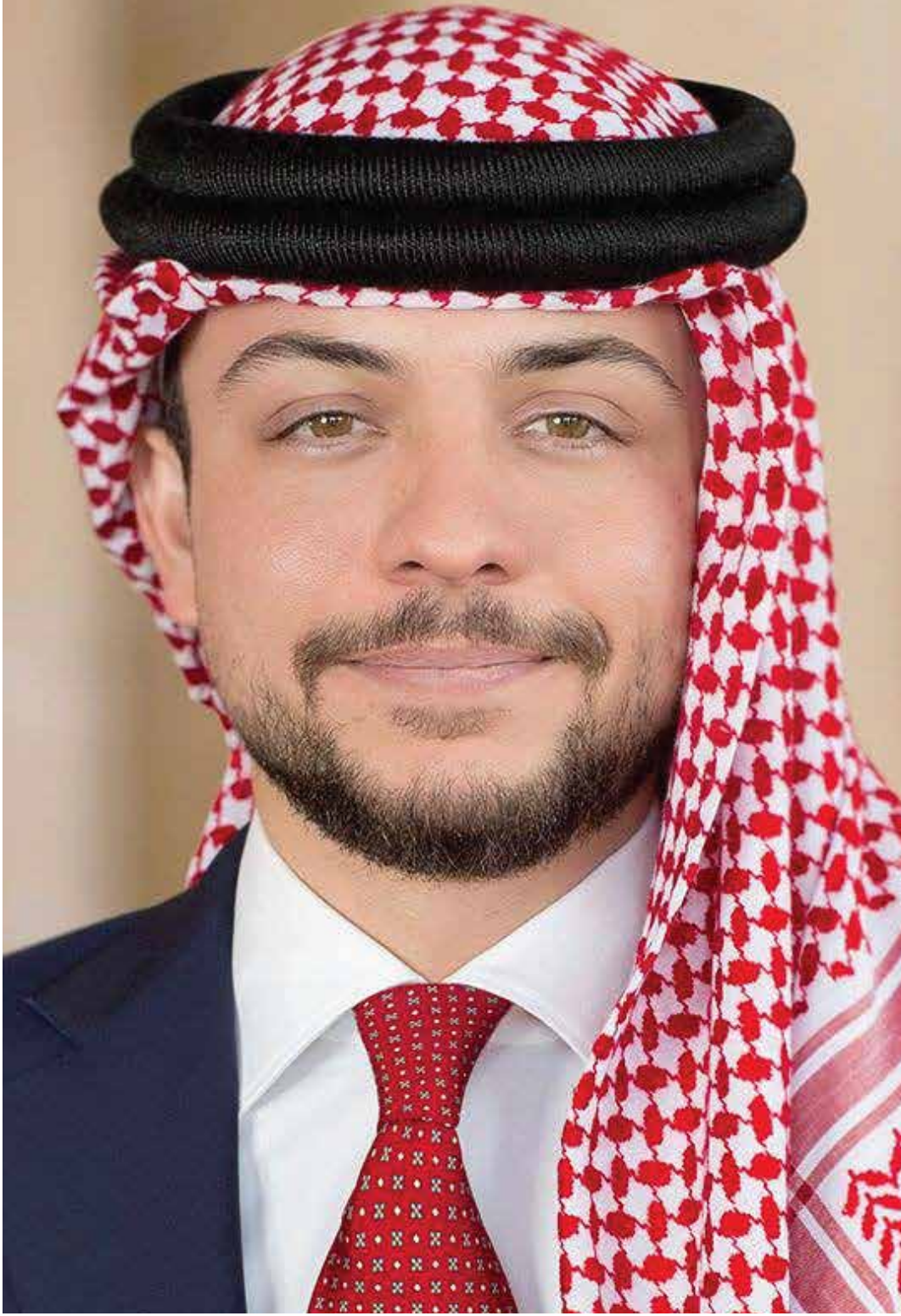
صاحب السمو الملكي الأمير الحسين بن عبدالله الثاني