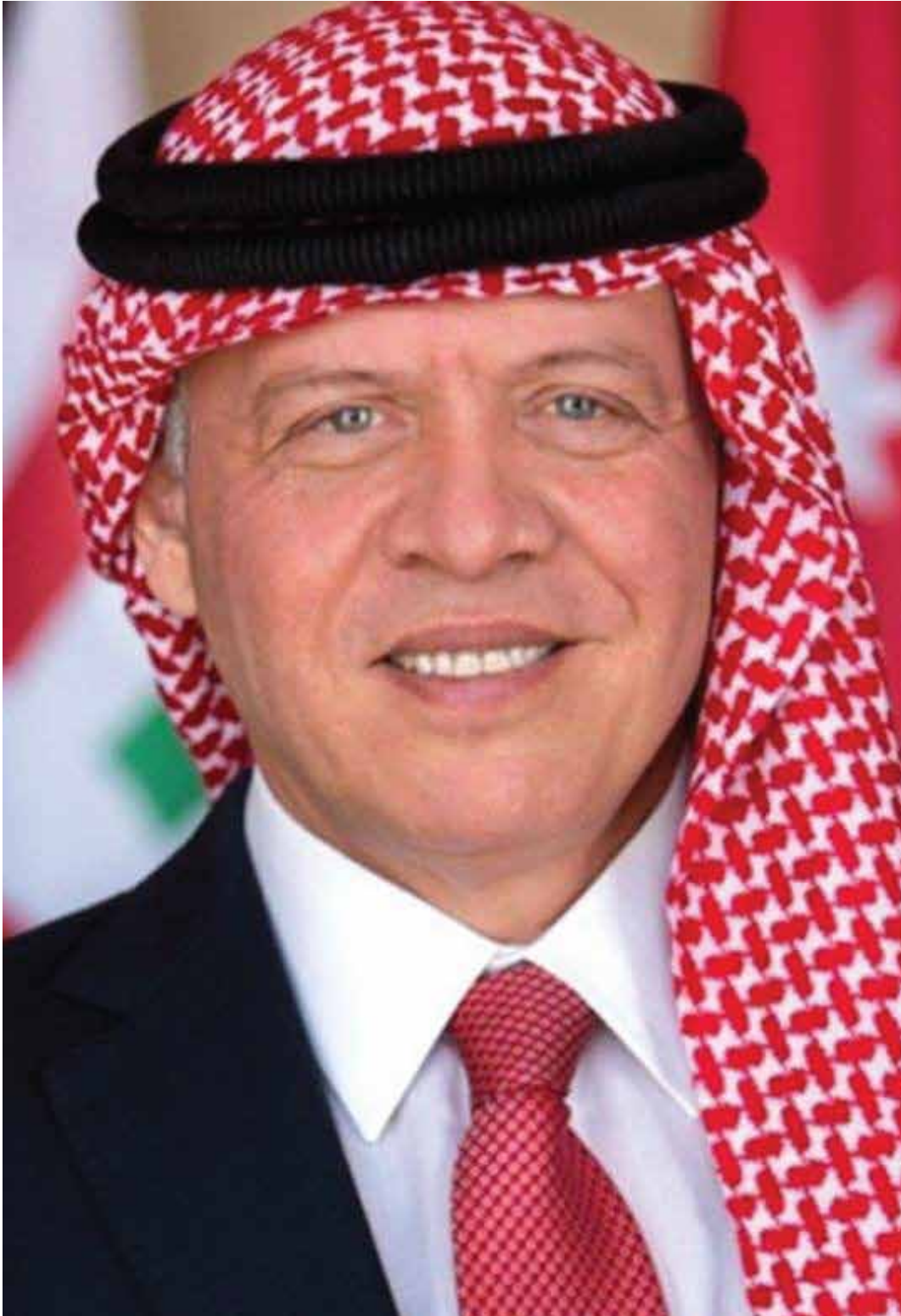
جلالة الملك عبدالله الثاني ابن الحسين المُعظَّم